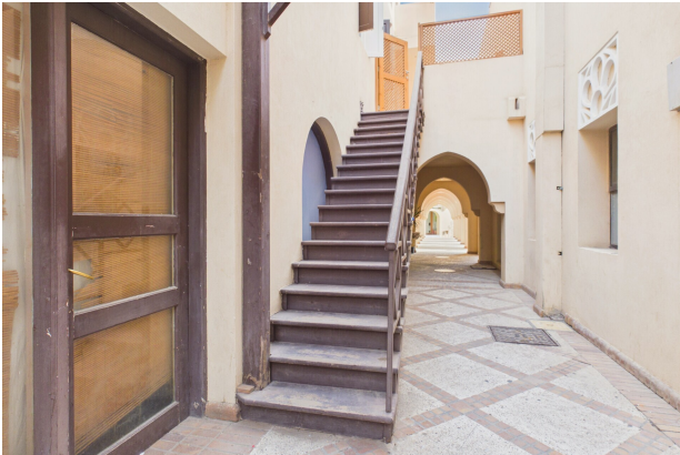
Stairs to Terrace