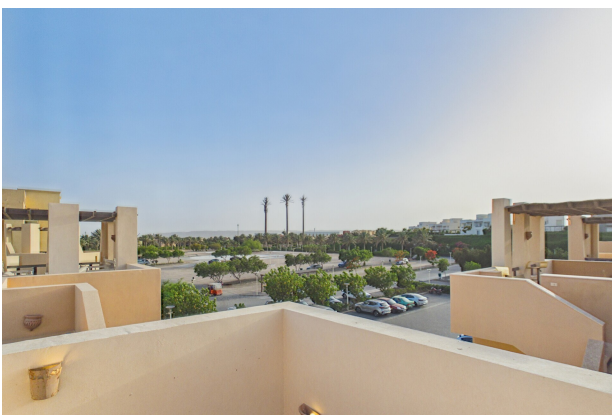
View Roof Top